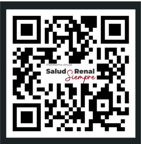
Figura 1. A) Ejemplos de contenido de la plataforma Salud Renal Siempre. B) QR de acceso a la plataforma.